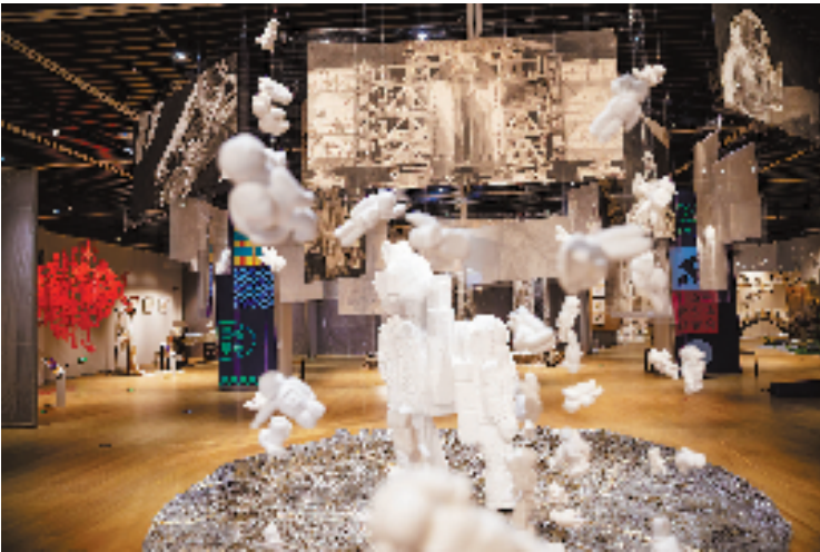
平湖黄姑实验学校作品

西瓜灯艺、少年问天、牛仔布艺、钟溪印象、纸版刻画、蜡板刻画、布印江南、植物拓印、纤维艺术、海娃剪纸……19所学校的大型美育