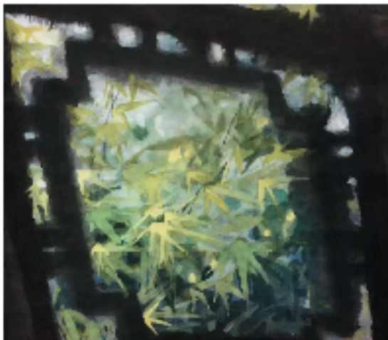
黄丽娟(上海市静安区教育学院) 窗外 国画