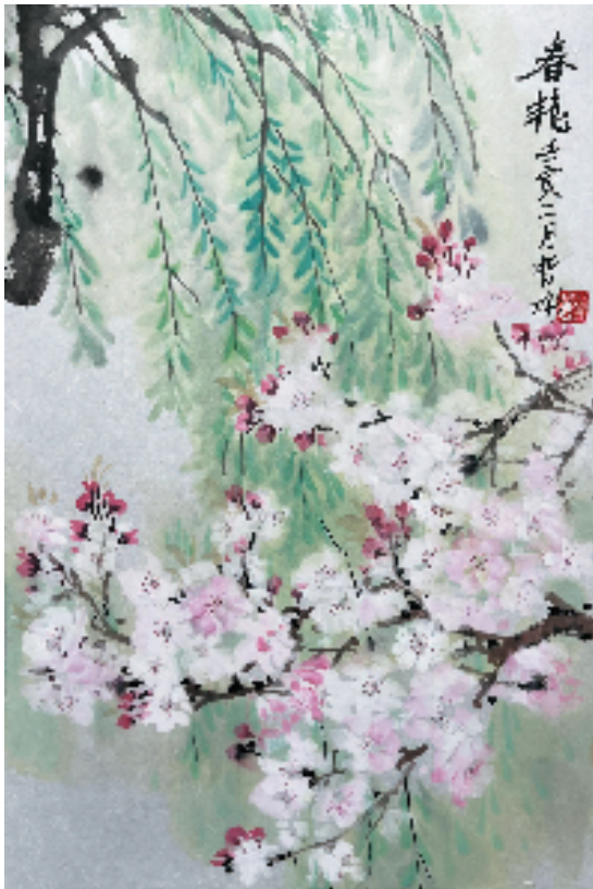
鲍哲彬(绍兴文理学院) 春艳 国画