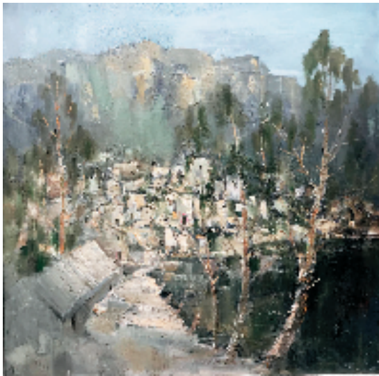
王国华(台州市三梅中学) 雨后 油画