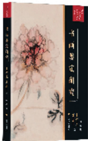
《书画鉴定研究》 王妙莲 傅申/著 赵硕/译 上海书画出版社/出版