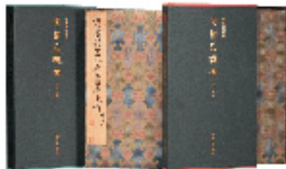
《善本碑帖精华·明拓乙瑛碑》 江吟/主编 西泠印社出版社/出版

全书收入美术评论、画家自述和采访整理文章22篇，总计112392字，10位作者分别来自美术院校、画院理论部以及美术和评论家协会，与此同时还邀请了国内著名理论家对部分入选艺术家的艺术成就作了重点点评。《杭州中青年美术家创作与评论研究》图文并茂印制精美，本书的出版，为读者呈现了杭州近年来中青年美术创作与杭州美术评论事业的重要阶段性成果。