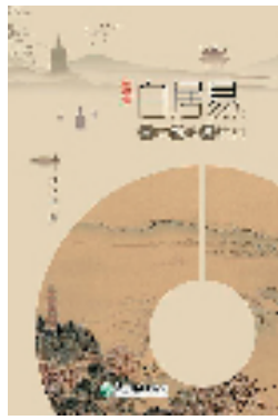
《白居易：与君约略说杭州》 司马一民/著 浙江教育出版社/出版

2022年是白居易任杭州“市长”1200周年，为了纪念这位受世代杭州人尊敬和爱戴的白“市长”，浙江教育出版社近日推出杭州市政协智库专家、杭州文史专家司马一民新作《白居易：与君约略说杭州》，新华书店以及当当、京东、天猫等网站都已经上架。