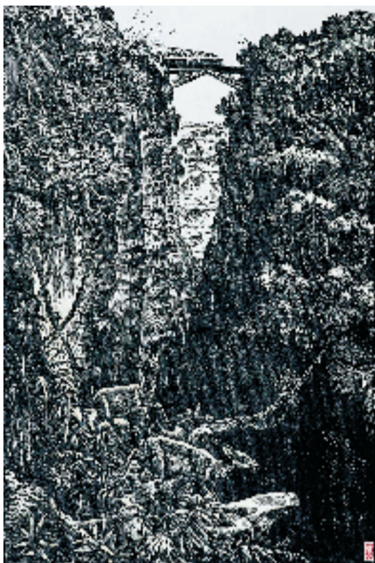
梁永泰 从前没有人到过的地方 木刻 1954年

作为国家艺术基金2022年度传播交流推广项目之一,本次展览已分别在多地举办巡展。未来,广东