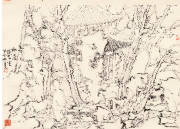
狮子林卧室 67x64cm 纸本水墨 2014