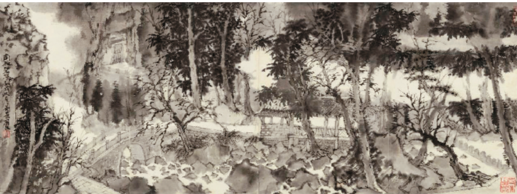
南雁碧溪 41x110cm 纸本水墨 2020