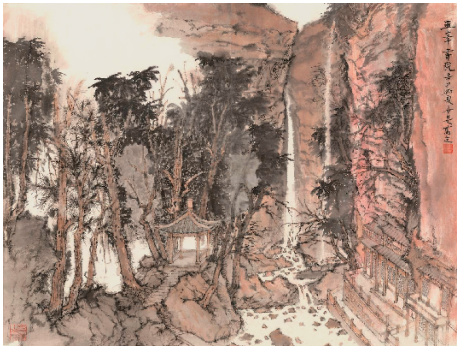
五峰书院 68x89cm 纸本设色 2021

他注重师法造化，在对境写生中搜妙创真；他执着于笔墨实验，画面上水晕墨章、氤氲冥漠。他挥写出山水画的诗性品格与意境，以苍润淋漓的笔墨创造出独特的风格面貌。他希望自己是这样的“学院派”：兼容文人画与院体画的优点，既有传统文人的审美和胸怀，重视自我心性的表达抒发，同时又具备院体严谨而理性的笔墨表现技巧。张谷旻的为人、为学、为艺的品格，一如他笔下山水一般有浩然正气，以此在艺术道路、人生道路上探索前行。