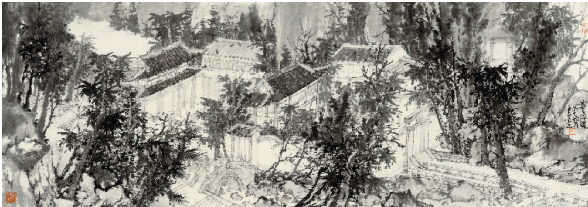
白云深处 45x134cm 纸本水墨 2013