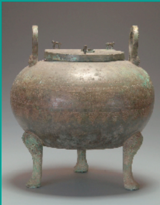
战国蟠螭纹青铜汤鼎

1982年3月，考古工作者在绍兴坡塘狮子山306号墓藏中发掘了一座春秋时期的墓葬，出土了铜鼎、铜罐、铜豆等一批青铜器。部分随葬品具有明显的徐国风格，其中就发现了这件非常精美的青铜房子。306号墓是一座春秋晚期的墓葬，这个墓葬出土的随葬品多达1200余件，是迄今浙江境内发现随葬物品最多、最精致的先秦墓葬。