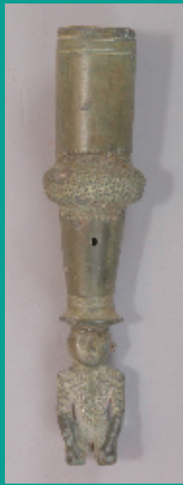
春秋战国青铜鸮杖墩