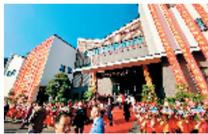
曹亚麟紫砂艺术馆

中国工艺美术大师曹亚麟师从国大师鲍志强。字希之。1955年出生于江苏宜兴,1980年毕业于景德镇陶瓷学院美术系设计专业,1981年进入紫砂工艺厂,从事紫砂陶艺术创作。现于中国紫砂博物馆专业从事紫砂陶艺术的创作和研究,并任副总工艺师。他从艺五十多年来一直