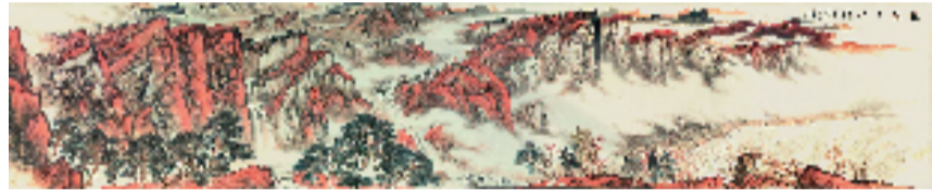
姜鸿泰 巍巍太行 1000x193cm

日前,新乡籍中国美术家协会会员、河南省侨联委员姜鸿泰创作的巨幅山水画《巍巍太行》在民建新乡书画院创作完成。该画长10米,高1.93米,主要取材于新乡南太行,画面中万山红遍,层林尽染,气势磅礴,气韵生动,艺