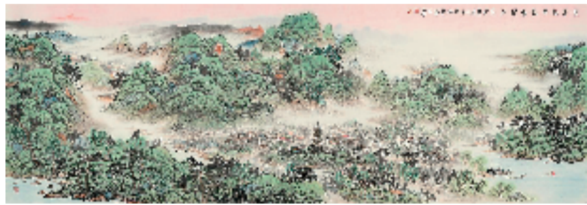
杨留义 仙华绿谷 长寿浦江

日前,“仙华绿谷 长寿浦江——城市山水画家杨留义浦江仙华写生作品展”在北京中华慈善艺术馆举行。本次展览主题为“以艺术解读生态文明建设,以行动打造城市文化名片”,以线上线下相结合的方式展出,集中呈现了城市山水画家、东方华夏文化遗产保护中心副主任、北京城市山水画研究会会长、华夏文化遗产中国画院院长杨留义多次在浙江省金华市浦江县采风写生后创作的