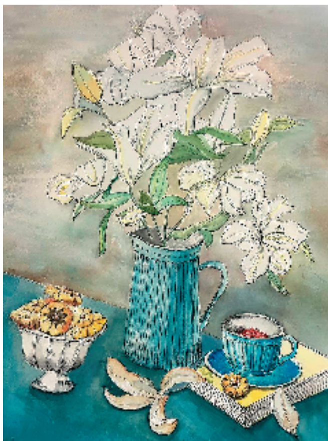
韩玲巧(浙江省海盐县滨海小学) 香百合 60×80cm 水彩画