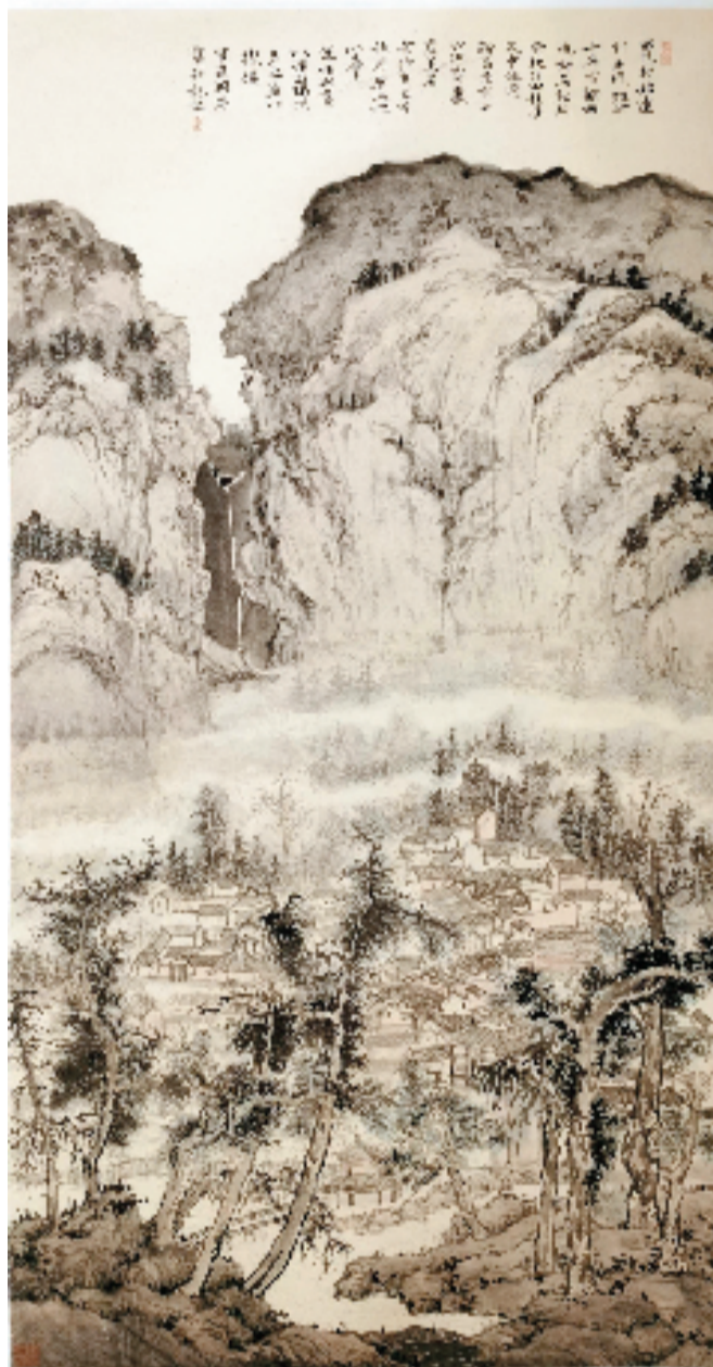
毛渊辰(中国美术学院) 溪山环拱图 南昌写生 69×138cm 中国画