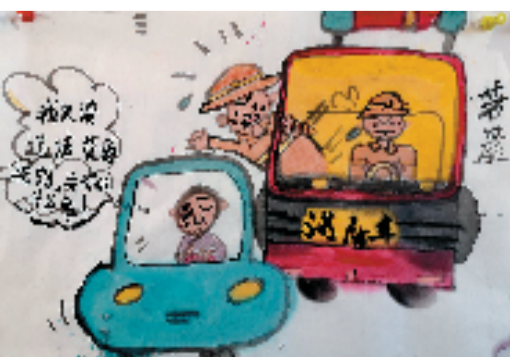
少儿水墨时事热点创作

各方面的仪式感,以求提高生活品位。在各种仪式里,就需要用到各式各样的物品,少儿用水墨表现这些生活物品,如生日蛋糕、五彩气球、红包、一杯红酒、礼炮、喜帖、气拱门、一束鲜花、一盆红枣、一盆花生、一盆桂圆、一盆瓜子……在表现这些生活中耳熟能详的仪式、物品的同时,也增加了少儿对生活仪式的进一步认识,更加热爱生活。