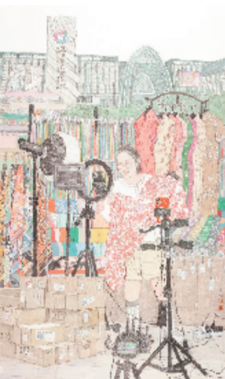
陈三石 衣被天下(盛泽丝绸) 122x204cm 中国画