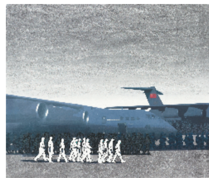
朱建辉 使命 102x120cm 版画