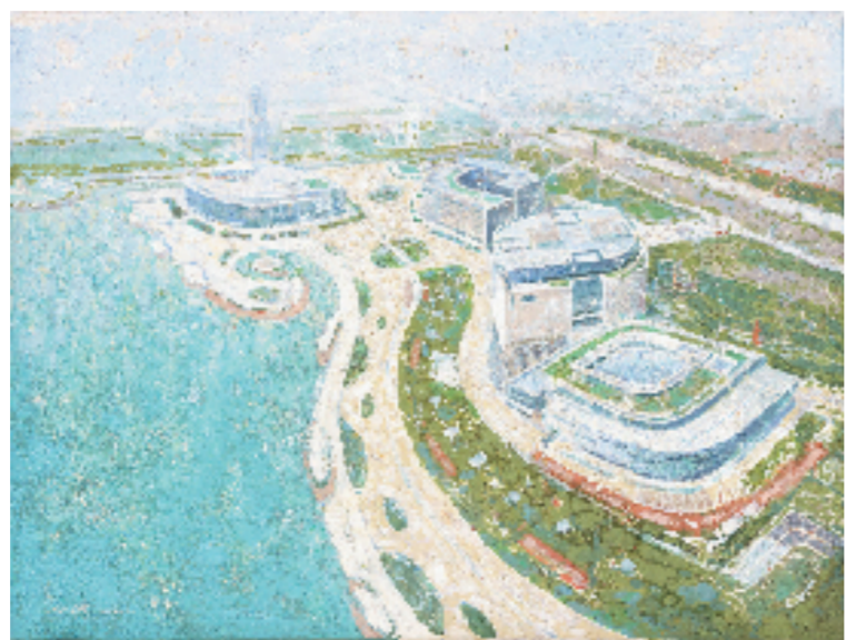
千帆 东氿新韵(宜兴文化中心) 70x90cm 油画