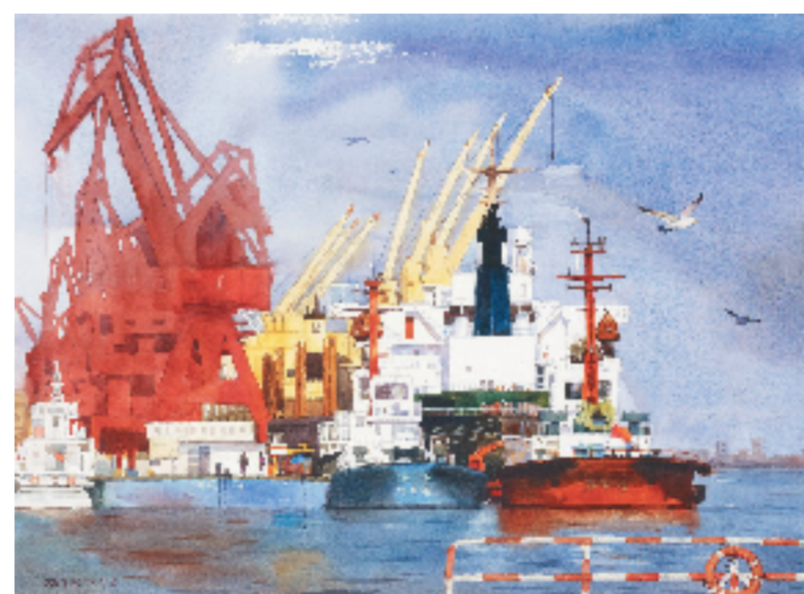
周胜宇 忙碌的港口 75x54cm 水彩粉画