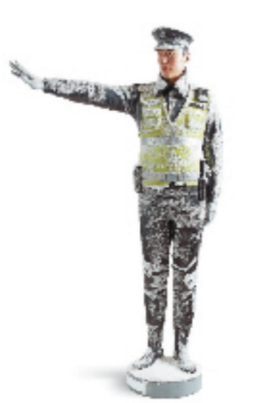
尹格铭 雪中卫士 160x95x35cm 雕塑