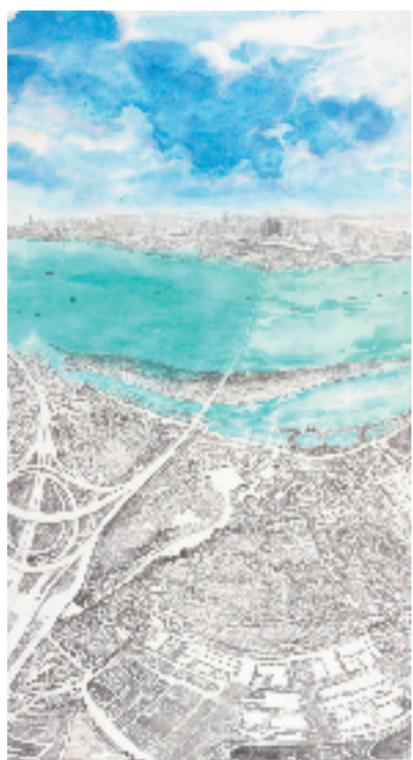
单鼎凯 南京江心洲大桥 180x97cm 中国画