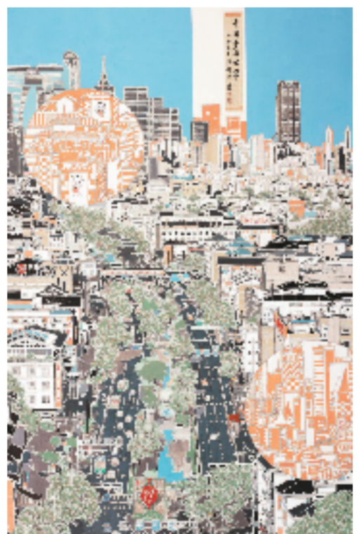
唐锡年 中国梦我的梦 170x230cm 中国画