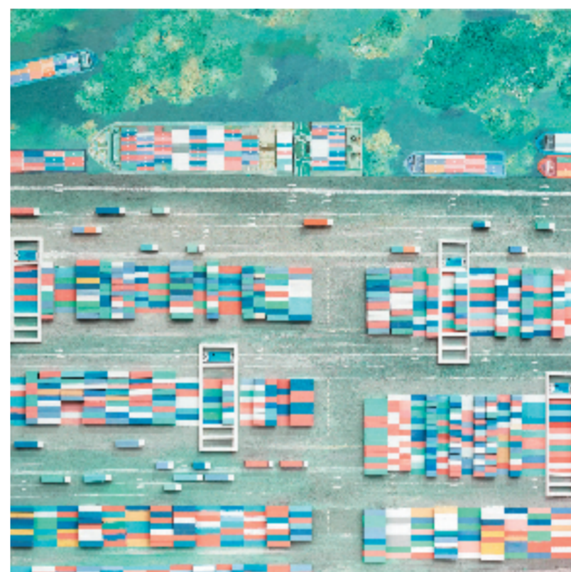
王悦 启航 100x100cm 综合绘画

展取得的历史性成就、发生的历史性变革,并把对新思想的宣传阐释、新成就的讴歌颂扬贯穿艺术家采风创作、作品策展巡展等各环节,实现重大主题全覆盖。联展创作展陈精彩。艺术家们饱含讴歌热情和创作激情,走进五彩斑斓的美丽乡村,探访激动人心的建设工地,深入科技感十足的企业车间,从红色遗址中汲取精神力量,在火热实践中捕捉创作灵感,用画笔描绘生活,将镜头朝向人民,共推出近2万幅美术摄影作品,在南京暨全省各地同步展出,共同唱响新时代的颂歌。联展组织力度空前。省、市委宣传部门牵头指导,省、市文旅厅(局)策划展陈,省、市文联系统组织采风创作,不仅在省美术馆(新馆)、省现代美术馆设主展场,同时,在各设区市及所属市县美术馆、新时代文明