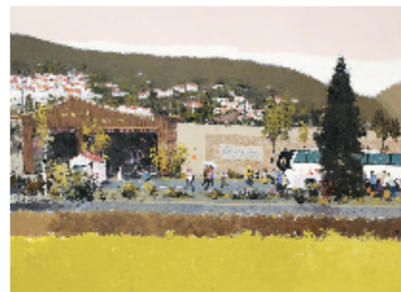
杨兵 黄窝新农村(连云港黄窝) 95x120cm 水粉