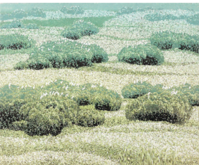
丁立江 运河新景 80x100cm 版画