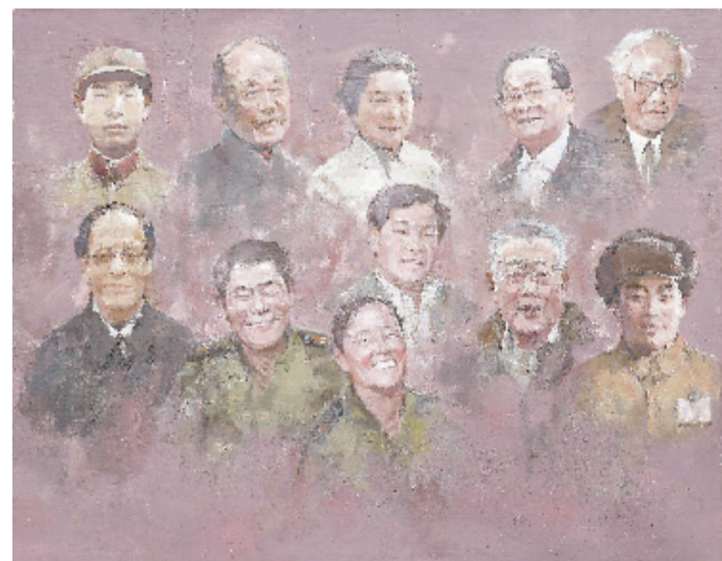
姚蓂 最美奋斗者 135x172cm 油画