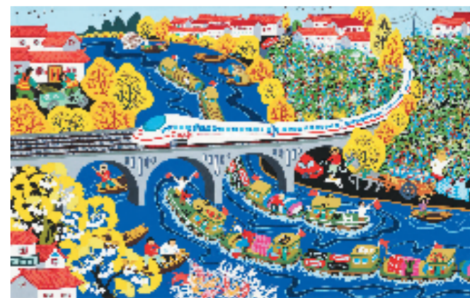
杨年成 运河两岸展富强 76x120cm 农民画