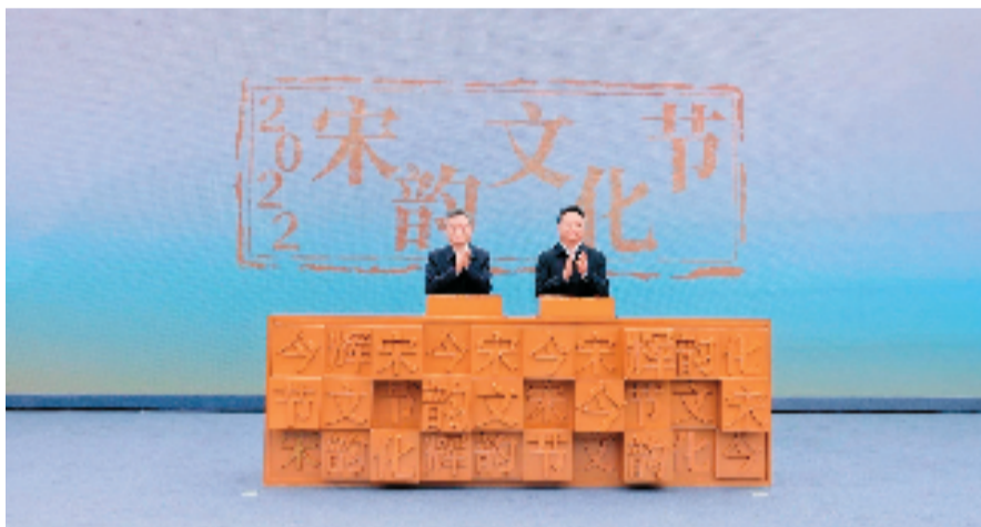
中共浙江省委常委、杭州市委书记刘捷和中共浙江省委常委、宣传部部长王纲为“2022宋韵文化节”启幕