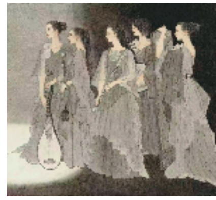
高云 期待 170x178cm

据本次展览的策展人李文刚、丁亚雷介绍，中国画赖以立世之处，在于中国画水墨语言的独特存在和丰富表现。在今天多元的艺术生态中，对水墨语言独特性的认识在中国画家中并没有太多的障碍，对水墨语言丰富性的理解，这却是一个随时可能引发争议的话题。中国画近世的道路已经表明，这不是一个人人都愿意接受的问题。特别是一旦中国