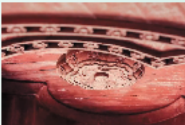
梅花亭内精巧的雕饰

勾一勾：根据顾文彬在《怡园十六景词并序》中对藕香榭的记载，结合它在怡园中的地理位置，请你猜一猜这个建筑的用途是什么？请在方框中勾一勾。