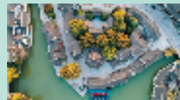
依水而筑的民居建筑