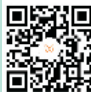
扫码观看教学视频

如果你有一座书斋，你会怎么命名呢？让我们先从书斋的花窗创作入手，用贺卡来做一扇具有创意的苏州苏式花窗吧！