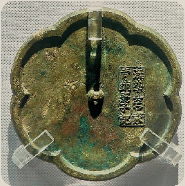
图 4:湖州真石家青铜照子

小朋友们,我们了解了宋代的商标与广告设计,那么我们现在的商标与广告设计有什么特点呢?