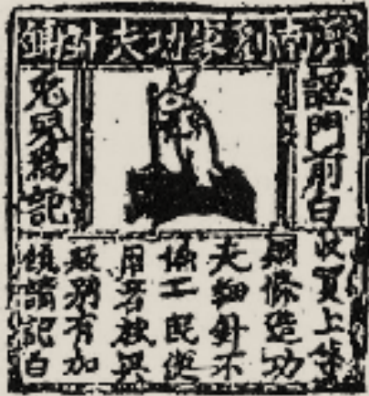
图 6:济南刘家功夫针铺铜版黑白图稿

宋代出现了印刷式的商标与广告,在中国设计史上具有重要的意义。中国国家博物馆中收藏了一件北宋“济南刘家功夫针铺”的雕刻铜版,是目前已知我国乃至世界上最早出现的商标实物(图 6:济南刘家功夫针铺铜版及黑白图稿)。铜版近乎于正方形,长 13.2 厘米,宽 12.4 厘米。铜版最上方标明了店铺的字号“济南刘家功夫针铺”。铜版中间的核心图形是一只正在捣药的白兔,白兔两侧刻有“认门前白兔儿为记”,是希望前来购物的消费者能够记得店铺门口的白兔商标。之所以选择白兔作为商标的主体形象,与消费对象的群体特征不无关联。在古代社会,针的消费群体以女性为主,宋代女性在七夕节拜月乞巧,白兔恰是一种月宫意象,针又是乞巧用具之一(注:这里的针与日常用针形制略有不同),所以用白兔作为商标形象能够使得女性对此品牌产生好感与认同感,从而达到了品牌记忆强化的目的。铜版最下方是 28 字的广告词,“收买上等钢条,造功夫细针,不误宅院使用,转卖兴贩,别有加饶,请记白。”既说明了自家产品优质的制作材料、精细的锻造功夫,也为大众提供了零售与批发等不同的经营方式。这种印刷式的广告,能够在短时间内大量印制,极大提升传播效率,是宋代商标广告宣传方式的重大突破。欧洲直到 1480 年才出现第一张索尔斯伯利式温泉疗法的印刷广告,说明中国的古代印刷商标广告比西方至少领先了 400 年。