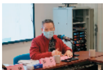
中国美术馆原副馆长、展览学术主持 梁江主持学术座谈会