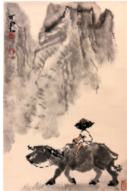
李可染 山牛 中国画