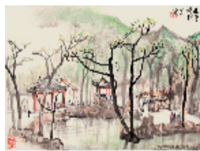
李可染 游寄畅园 中国画