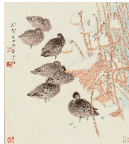
贾俊春 春雪 36×32cm