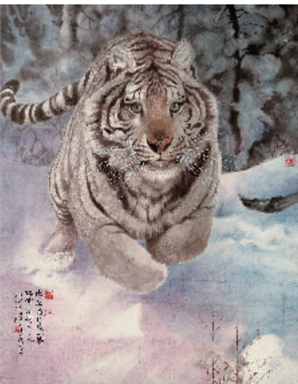
韩山 白虎 122.6×96cm

也是画院所有画家们收获总结的时候。丹枫如霞,妙墨成章——这正是此时听枫园内的景象,这也应该是苏州美术界的一道独特亮丽的风景。置身新时代、迈进新征程,苏州国画院将始终立足于吴门绘画的血脉传统,深入学习贯彻党的二十大精神,切实肩负起新时代文艺工作者的使命,紧随时代的步伐,守正创新,坚守人民立场、坚守中华文化立场,立足苏州大地、讲好苏州故事,让艺术更好地融入到百姓生活,让人民感受到艺术的温暖和力量,为当代吴门绘画在江苏乃至中国美术界的影响力之持续提升而不懈努力。