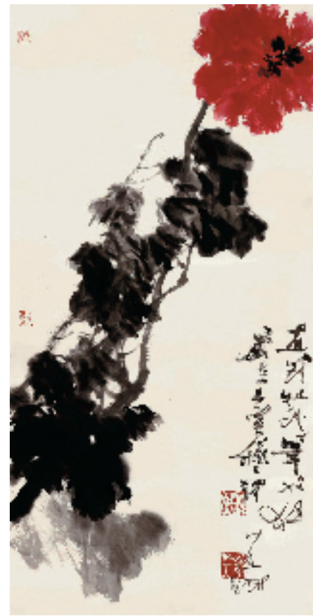
谭以文 画到牡丹笔也狂 136×68cm