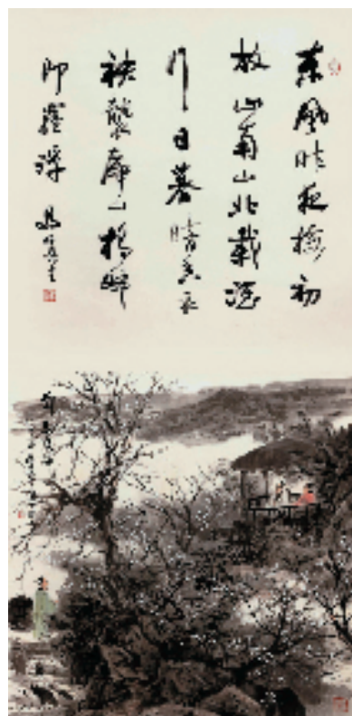
马伯乐 邓蔚赏梅 136×68cm