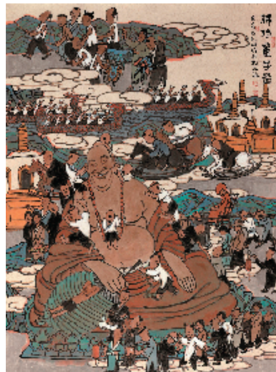
周矩敏 佛佑童子图 136×100cm