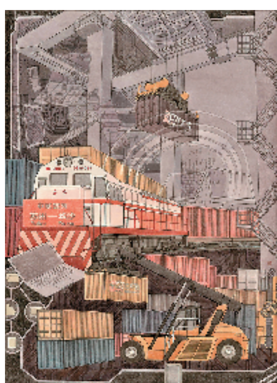
张娟 中欧班列(苏州—波兰) 165×120cm