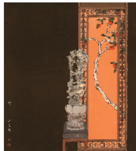
孙宽 恋 66×66cm