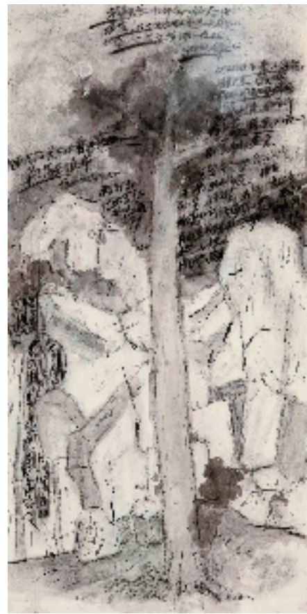
夏回 辛丑纪事之二 250×130cm