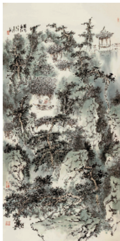
孙君良 绿窗客话 136×68cm