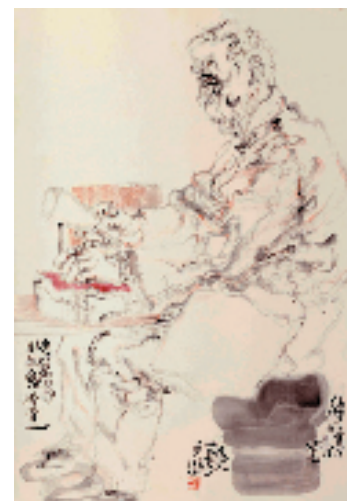
李亚光 老艺人速写 68×46cm