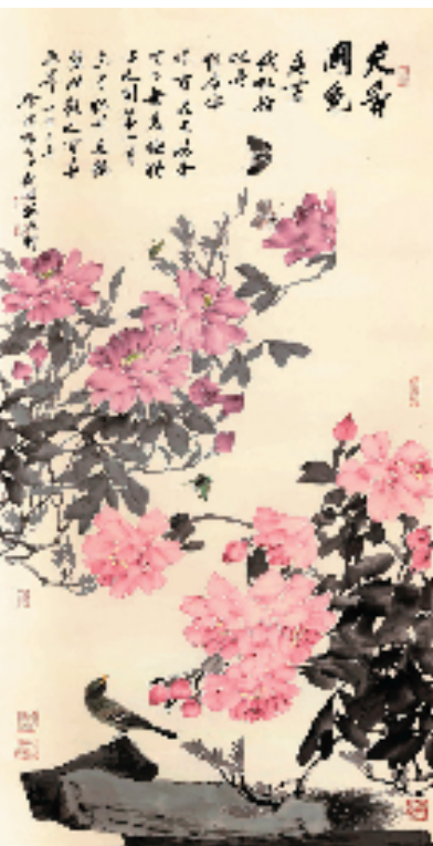
徐源绍 天香国色 136×68cm