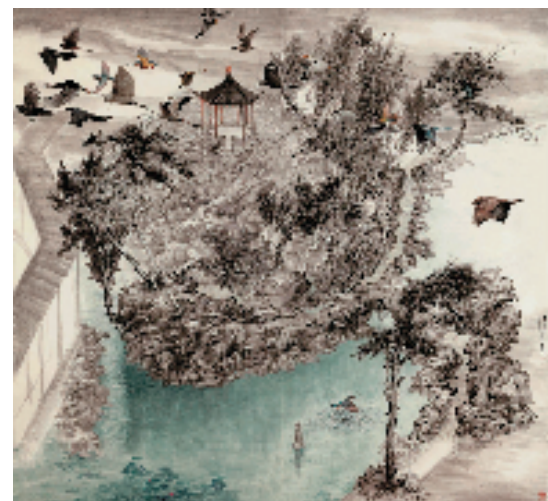
鞠崧楠 掠过怡园 180×188cm