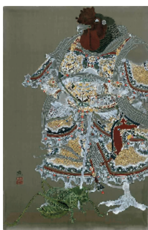
苏锐 大吉 100×50cm