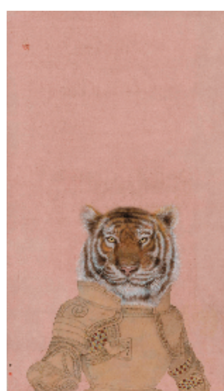
华彬 虎 86×50cm