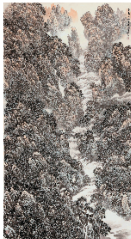
吴雍 黄岳之魂 180×97cm