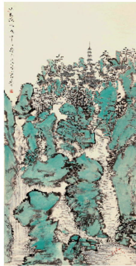
冯豪 水国澹滟城中山 136×68cm