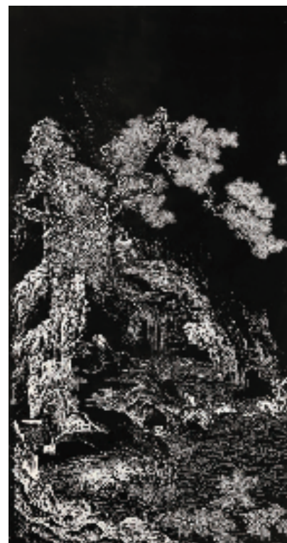
蔡廷辉 东邨图 136×68cm