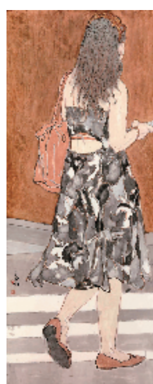
陈三石 擦肩而过 168×68cm