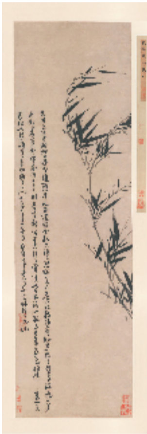
元吴镇仿苏轼湖州《风竹图》(美国华盛顿弗利尔美术馆藏)