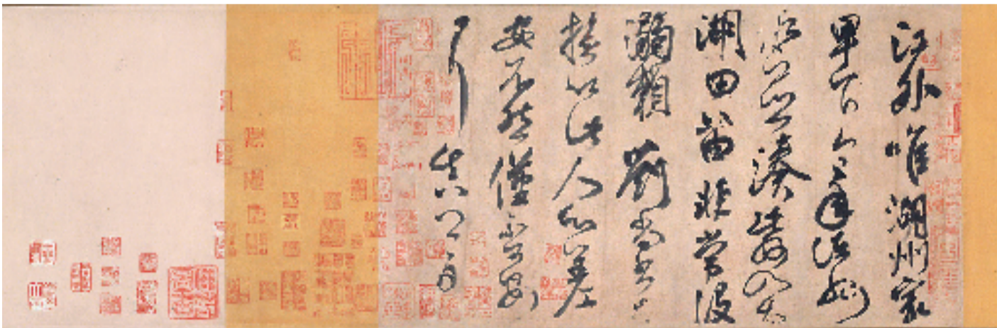
颜真卿《湖州帖》(北京故宫博物院藏)