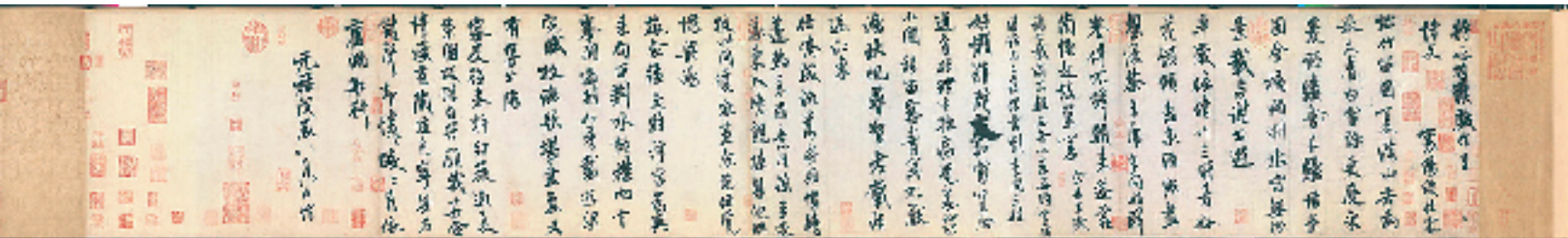
米芾《苕溪诗帖》(北京故宫博物院藏)