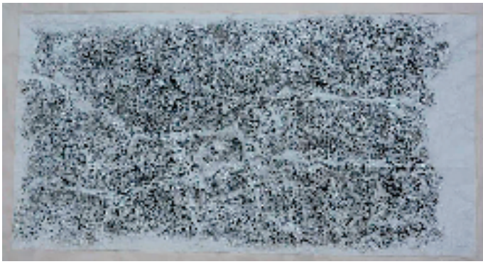
水口西顾山最高堂杜牧题刻