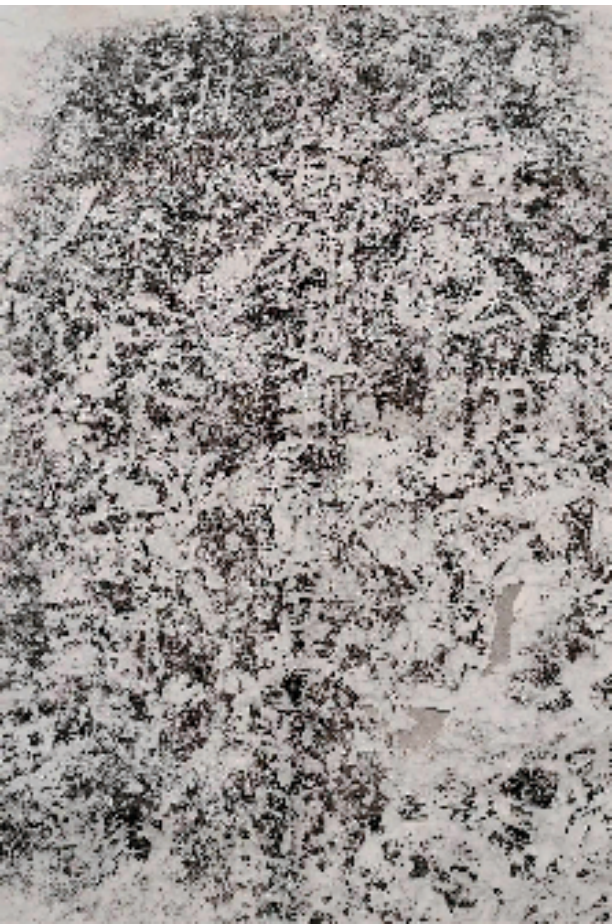
水口斫射畚老鸦窝李词题刻