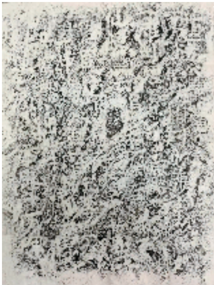
水口斫射畚老鸦窝张文规题五公泉诗题刻