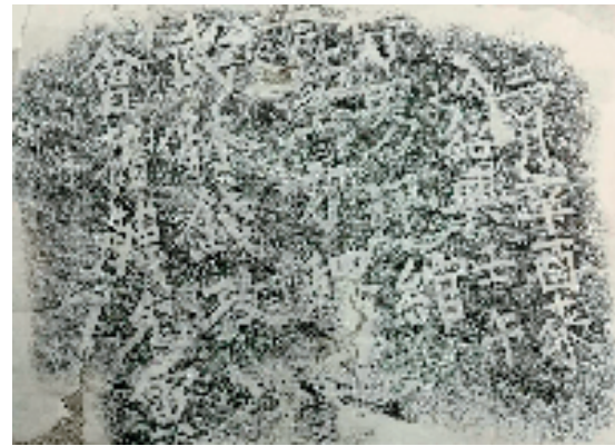
悬白畚霸王潭韩允寅题刻