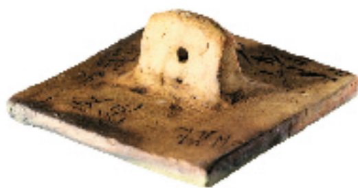
释文 参万岁而一成纯(连款)