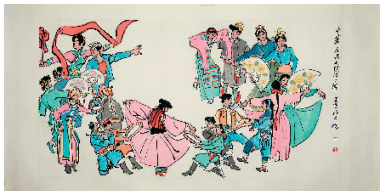
叶浅予 中华民族大团结之舞图