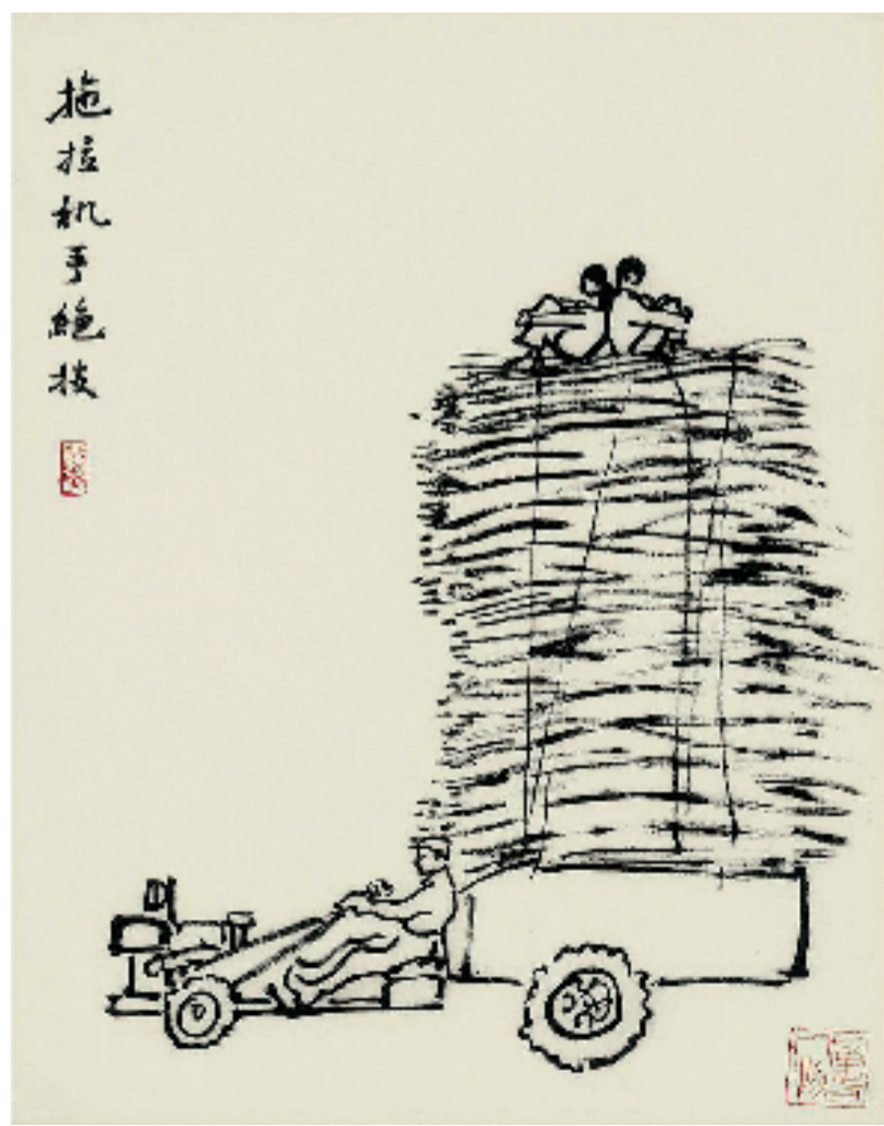
叶浅予 拖拉机手绝技