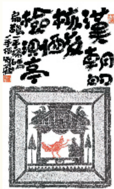
陆一飞题汉画像“汉朝的核酸检测亭”