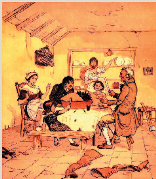
《唱一首六便士之歌》

1938年，美国图书馆协会成立了凯迪克大奖，用于命名全美每年最杰出儿童图书大奖。凯迪克大奖是美国最具权威的图画书奖，被认为是图画书的“奥斯卡”奖。该奖项的重要考量标准是要以儿童为本位，符合儿童的心理与情绪的表达，以儿童视角、理解力、审美情趣为创作依据，能够寓教于乐和启发孩子的想象力。而这些正是伦道夫·凯迪克儿童图画书的核心。