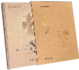
《唐卡艺术:传承与创新》 藏汉对照版 刘忠俊/著 白玛才仁/译 四川美术出版社/出版

民族文字出版专项资金资助项目《唐卡艺术:传承与创新》藏汉对照版是以中华民族优秀传统文化中弥足珍贵的非物质文化遗产——唐卡为研究对象,从实践到理论进行了全面整理与归纳。本书以宏观视角详细论述了唐卡的历史起源、发展脉络、流派演变、内容传承及技法仪轨,还从传承与创新的视角出发,将唐卡艺术在当代的文化保护、创作创新和周边影响做了深入浅出的梳理,并集合不同时期、不同地域、不同风格的众多珍贵图像与名家名作,全方位呈现出唐卡艺术的博大与瑰丽。这本图文翔实、制作精湛的理论专著,是近年来由国家民族文字项目出版发行的精品书籍。填补了同类书籍中既有传统与创新,又是藏汉双语版的