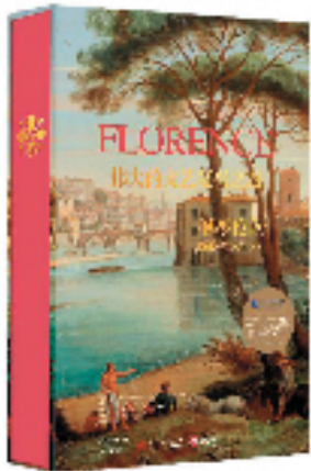
《徐敬周》 法译 佛罗伦萨 伟大的文艺复兴 弗内什 20年历史与艺术 克拉克 出版 著