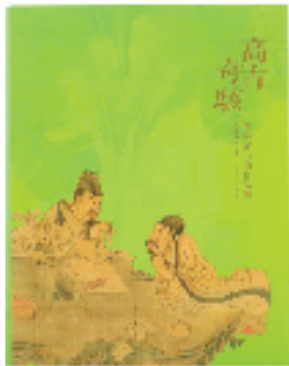
《高古奇骇》 绍兴博物馆 陈洪绶书画作品 故宫出版社 故宫出版社 出版 编