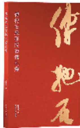
《傅抱石致张院西》 西泠印社 邱味味 出版 编