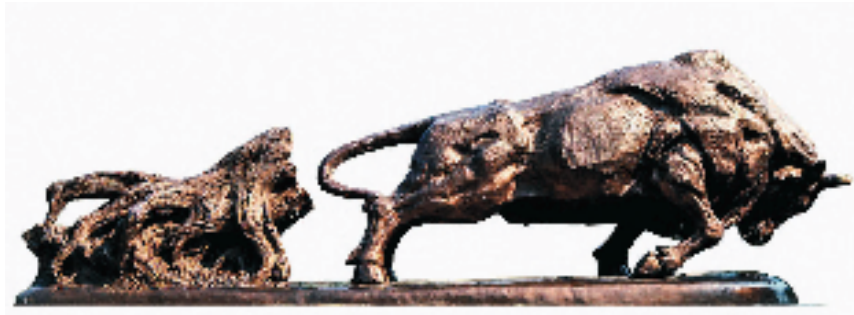
潘鹤 开荒牛 雕塑