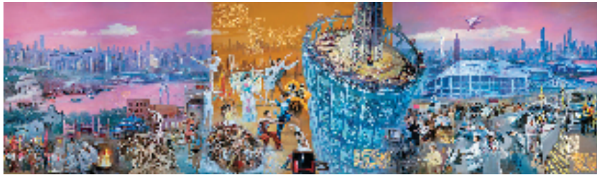
汪晓曙 陈铿 出新出彩 油画