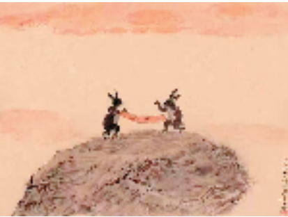
林海钟 癸卯吉祥 33×25cm 2022年

林海钟数字艺术品发布会同期拉开帷幕,35幅共设原画作品和799幅衍生品首发面世。同时,承载了杭城宋韵、西湖文化的林海钟艺术衍生品“西湖诗意书灯”同步亮相。林海钟数字艺术品,通过收集合成产生从未面世过的稀缺性隐藏