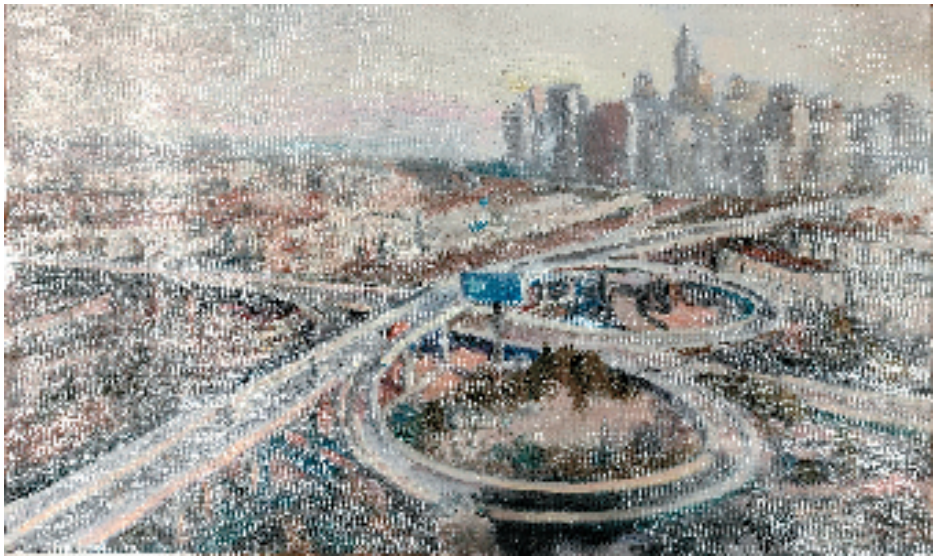
俯瞰绍兴,欣欣向荣

千年古城,十年蝶变。党的十八大以来,绍兴勇扛重担、勇争一流,坚持“八八战略”总纲领总方略,扛起“五个率先”新使命新担当,一张蓝图绘到底,一任接着一任干,经济社会各方面发展取得不俗成效,以全国万分之八的土地面积,创造出全国千分之六的生产总值。