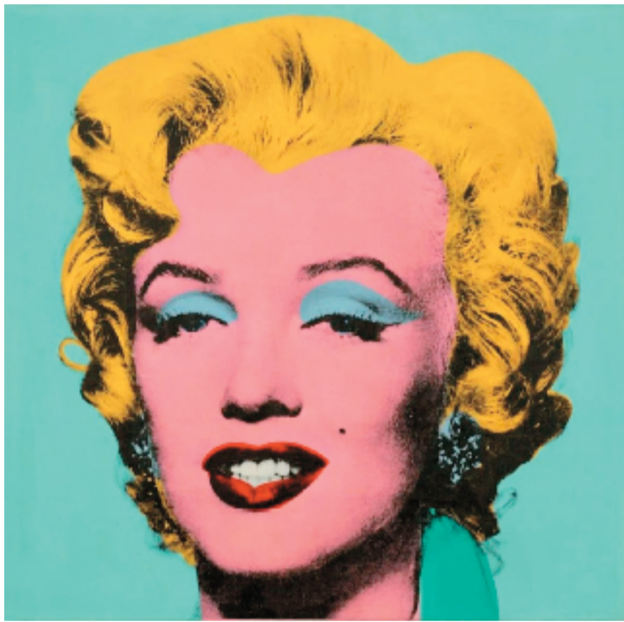
美国画家安迪·沃霍尔1964年作《枪击玛丽莲(鼠尾草蓝色)》丝网版画(2022年纽约佳士得1.9504亿美元成交)

四是美国艺术家接连创下摄影作品的世界纪录。如曼·雷《安格尔的小提琴》(雅各布斯·斯伉俪珍藏)的摄影作品出人意料地以1241.25万美元的天价成交,美