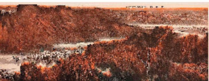
纪振民、姬俊尧 江南秋 214x550cm

本报讯 骆阳 2月21日，由江西省美术馆、天津市美术家协会、江西省美术家协会主办，天津金带福路文化传播中心承办的“北雄南韵 水墨意象——‘天津二J’纪振民、姬俊尧艺术作品展”在江西美术馆开幕。来自江西省、天津市两地政协、文联领导和书画家代表参加开幕式。