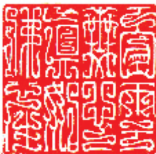
金林西篆刻 释文：白云无心 真如佛性