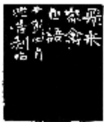
金林西篆刻 释文：飞来家禽自语