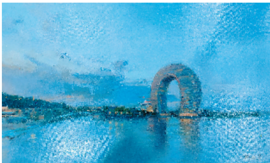
杨铁军 太湖月亮湾的美丽傍晚 30×50cm 油画

《太湖月亮湾的美丽傍晚》描绘了湖州吴兴月亮湾景区傍晚时分的景色,这里是最美的太湖水湾,有一个著名的酒店,便是喜来登月亮酒店。画家取景一角,用了蓝色作为主色调,配以黄色点缀,画面显得宁静又温暖,整体构图简单却层次分明,空间感十足,富有意境。