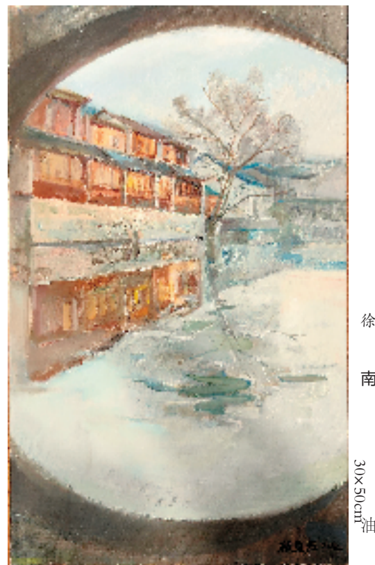
徐南 30×50cm 油画

湖州始终坚持以百姓之心为心,全力打造共同富裕绿色样本,推动生态红利源源不断地转化为百姓福利。湖州成为全省唯一的全市域缩小城乡差距试点市,基本公共服务满意度评价连续三年居全省首位。湖州坚持“四治”融合,获评全国社会治理创新典范城市、全国法治政府建设示范市,在全省实现平安湖州“十五连冠、金鼎加星”。