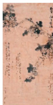
明 徐渭 墨葡萄卷