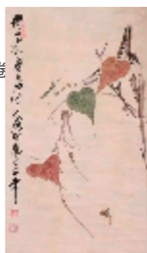
齐白石 设色花卉草虫