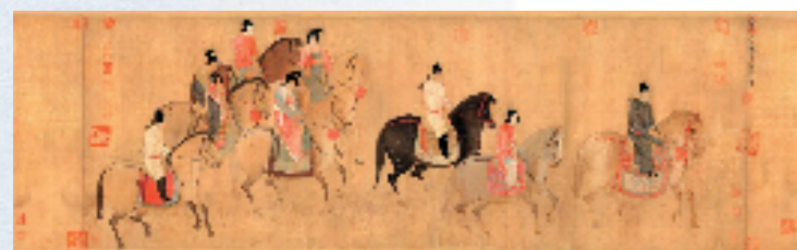
唐 张萱 虢国夫人游春图

中国画因为表现的技法不同,可以分为工笔画、写意画、兼工带写等三种技法。唐代张萱的《虢国夫人游春图》属于其中的____技法;明代徐渭的《墨葡萄卷》属于其中的____技法;现代齐白石的《设色花卉草虫》属于其中的____技法。(附三幅图)