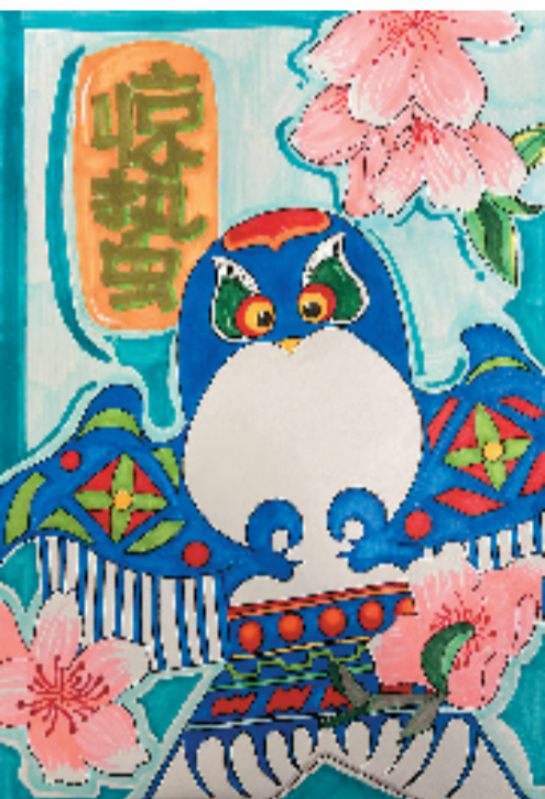
◀鲍密迦(武义县明招小学) 惊蛰 指导老师:何敏玉

红与绿作为色彩对比,一样多还是谁多谁少? 难搞! 胡淑涵创作《你好春天》,红压黑黄绿衬白黑,巧妙!