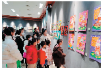
“万物苏 展鸿兔”葫芦岛市儿童艺术展