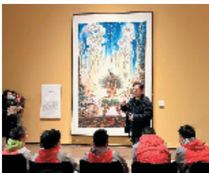
中华艺术宫(上海美术馆)“美术馆现场教学课”

2023年,“打造100个‘社会大美育’课堂,推出5000场艺术普及教育活动”被