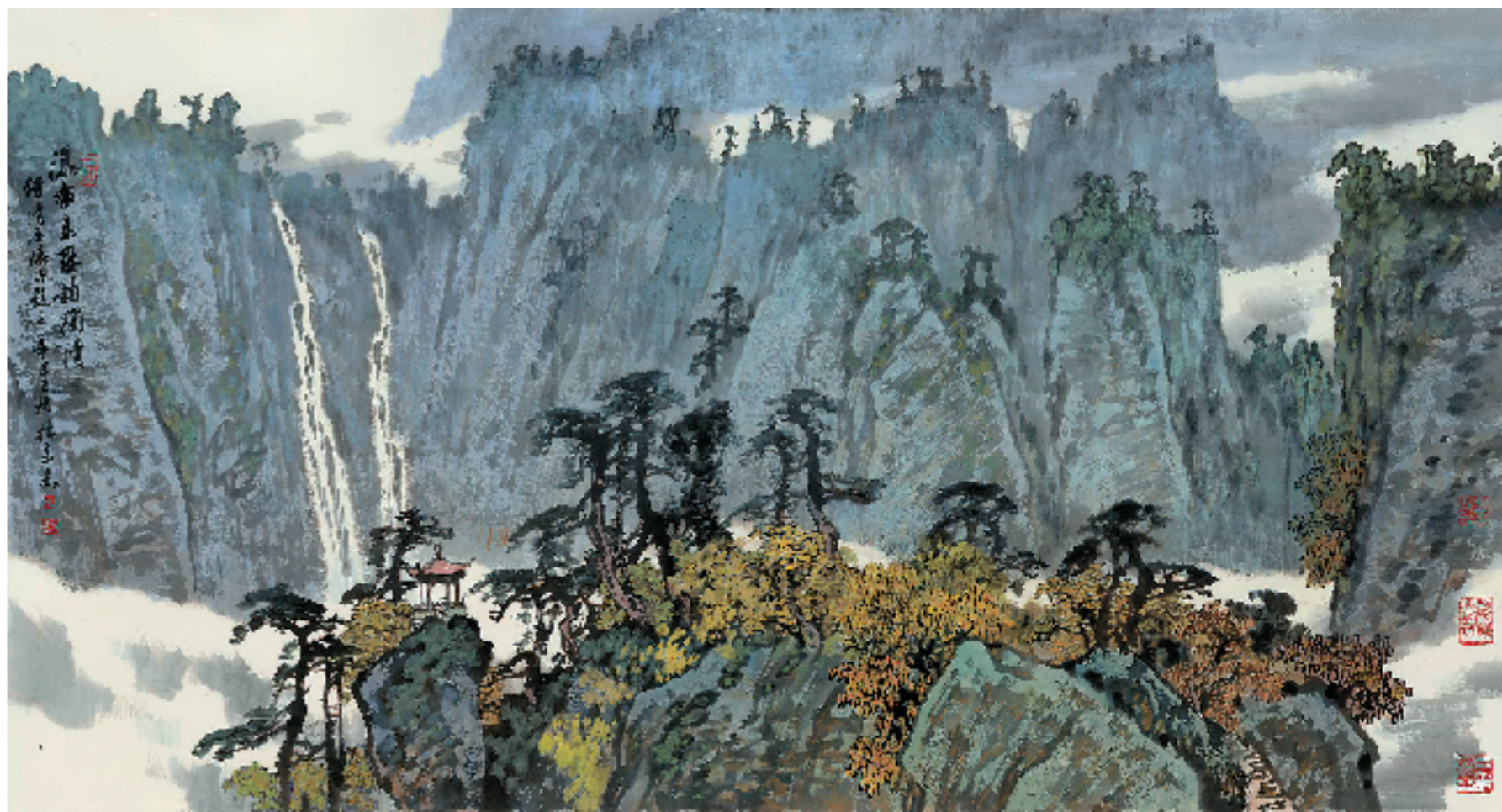
杜高杰 危峰陡绝 2021年