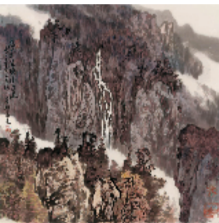
杜高杰 危峰陡绝 2021年

我的积色法是在中国画水墨技法的基础上吸取了传统的没骨法、青绿设色法、浅绛设色法以及西方印象派色彩技法、俄罗斯巡回展览派色彩技法融合而成，是借古开今，融