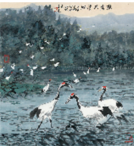
杜高杰 鹤鹭共清池 2022年