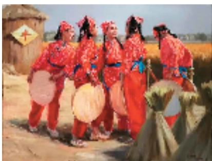
吴雅兰 丰收节的喜悦 油画 80x60cm

组委会本着公开、公平、公正的原则,邀请部分著名画家和理论家组成评委会、监委会,负责作品的评选、监评。初评经过三轮6个多小时的认真评选,