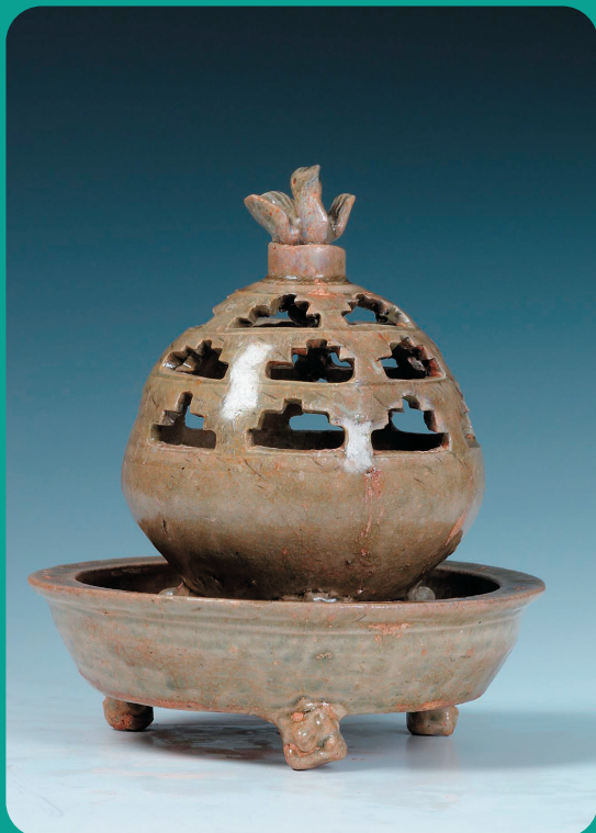
西晋越窑青瓷镂空熏炉

瓷器熏炉作为士大夫阶层使用则始于三国时期，两晋南北朝时期流行，如东晋时期的德清窑黑釉熏炉【见图】，一直流行到明清。