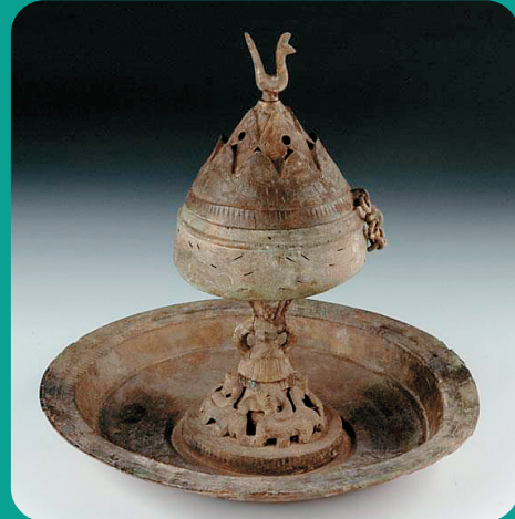
西汉 铜博山炉 鹤子岭出土