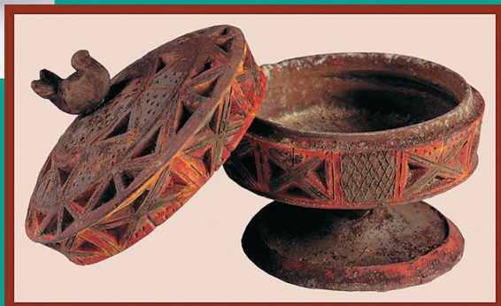
▼西汉 彩绘陶熏炉 一号汉墓出土