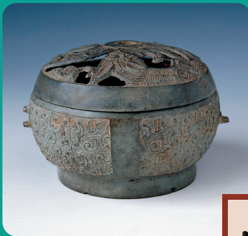
战国 镂空蟠凤纹铜熏炉

香文化有着千年的记录，熏香、熏炉映射着古代贵族精致的生活情趣，它见证了中国文化兴盛与衰弱，经历了各个朝代的更迭。而我们通过战国镂空蟠凤纹铜熏炉【见图】、西汉一号汉墓出土的彩绘陶熏炉【见图】和南越王墓出土的陶熏炉【见图】等经典的熏香之器，仿佛能嗅到在历史长河中曲折地流淌着的香气；在时间和历史的沉淀之下，这些古老的香具散发出的气息仿佛一朵朵神秘之花带领我们窥探到古代文人墨客的风流与儒雅、达官贵人的奢靡与阔绰。因此有“中国香文化，起始于远古，萌发于先秦，初成于秦汉，成长于六朝，完备于隋唐，鼎盛于宋元，广兴于明清”的说法。