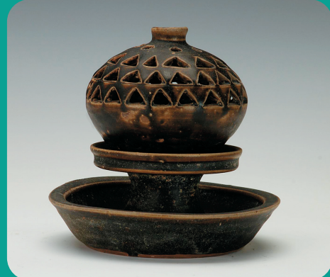
东晋德清窑黑釉熏炉