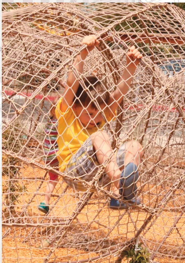
用麻绳编织的攀爬网为孩子们带来了无穷的乐群

不过索诺玛小镇儿童博物馆与其他博物馆的理念有些不同,它是一片开放式的互动娱乐区,使博物馆与大自然联系在一起,在这里孩子们可以了解蝴蝶蜕变的故事、农场主一天都做了什么、砾石床和沼泽的形成等,为孩子提供了一个自由的学习场所。