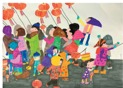
福来福见——首届福建少儿美术展出季 福州地区全芷璇《春见福》

此次展出季面向全省青少年儿童征集“福”文化主题作品近8000件，从中评选出1700件作品，各地市入选作品已先后在三明、厦门、宁德、平潭、龙岩、南平、泉州等地展出，接下来还将在漳州、莆田等地与观众见面。