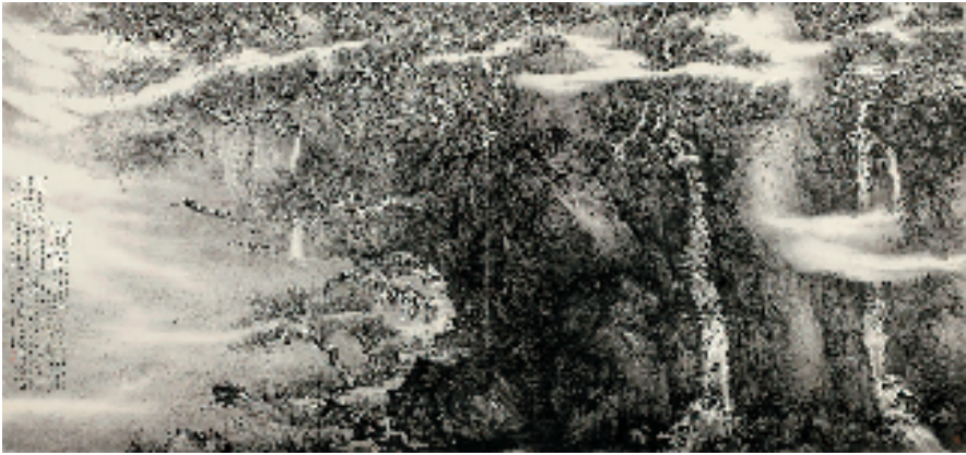
张捷 赤壁夜泊 180x385cm 纸本水墨 2018年

换,在客观上要充分了解大自然气象万千的“物理”知性,主观上实现笔墨技能和自我艺术态度的“情理”转化。自然物象是客观的相对稳定的表象概念,而写生中主观意念的“物随心移”是动态而变化的意象理念,是情感笔墨记录最为真实的生命状态。山水画的“天道”精神有着强大的内在力量,它对“天地与自我”之间的思想资源提供了无限的依据和可能。“知性”和“正