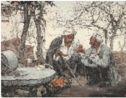
吴宪生 家常话 220×240cm 中国画 2011年

本报讯 通讯员 杨子 4月16日,由中国美术馆、中国美术学院、中国美术家协会共同主办的“以神取形——吴宪生作品展”在中国美术馆开幕。本次展览是中国美术馆学术邀请系列展之一,分“为时代铸魂”“为民族立心”“为人民造像”“为生活写真”4个板块,共展出吴宪生从艺50年来不同时期的绘画作品165件。这些作品集中体现了吴宪生半个世纪以来的绘画风格和艺术成就,折射出他对中国人物画语言探索与实践的心路历程,同时也反映出他热爱生活、以人为本,用画笔表达对万物沧桑的理解和对天地人间的感知。民盟中央副主席、中国美术馆馆长、中国美术家协会副主席吴为山认为:“吴宪生坚守了洞察精神世界、观察人物特征的初心,他深入生活、自然流露、直陈感受,长期与现实互动而油然而生发,用兼备个性、共性与时代性的‘人民形象’生动诠释了现实主义与当下中国、当下中国人、当下中国美术融合后