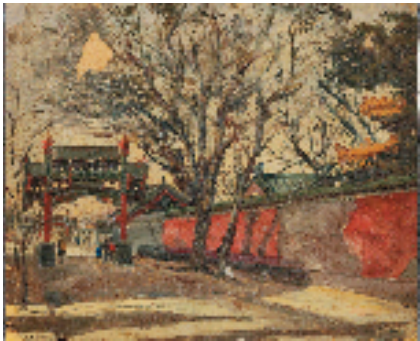
李家桢 北京的木牌楼 28×34cm 油画 1956年 浙江美术馆藏

似之间”这一观念运用到自己的风景油画作品中,他把所见的风光用传统水墨画写意笔触来抒发内心的激情,已然“意在笔先”,积极探索中国风景油画民族化风格,呈现出较为深厚的东西方绘画底蕴。