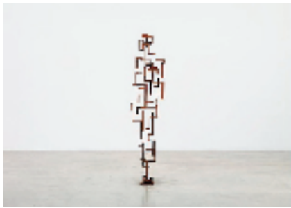
安东尼·葛姆雷 环形 195×42.5×25cm 2019年 8毫米耐候钢

葛姆雷表示,“这次展览反映了人类如何日益被人造环境情境化。正如古语所云——我们创造了世界,但世界也创造