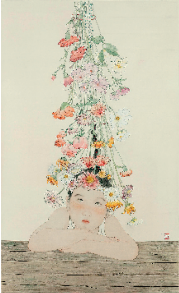
周吉雯 花花世界 50x80cm 绢本设色 2021年

创作笔记:工笔画在中国画艺术史上一直占据着重要地位,其中,人物画成就突出。古代的人物画一般以道释和仕女题材为主,直到宋朝才出现了专门描绘儿童主题的工笔画。这张创作我将儿童作为画面主体,构图纯粹,造型奇幻,以儿童的视角去看待客观世界,挖掘孩童天真美好的内心情感,表达了一种对童年以及对纯粹烂漫的追忆。