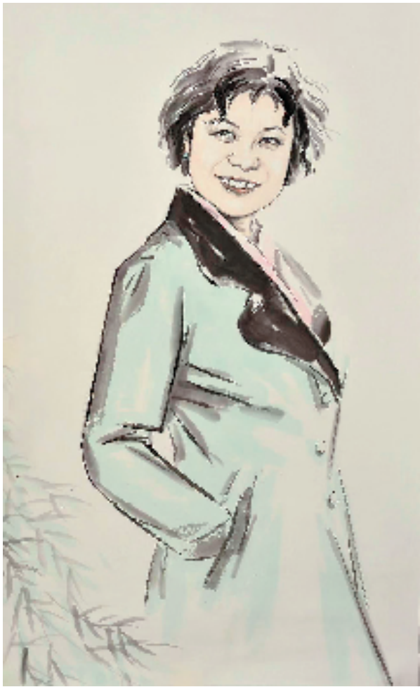
孙树伟 春风 60x104cm 中国画 2022年

创作笔记:工笔画在中国画艺术史上一直占据着重要地位,其中,人物画成就突出。古代的人物画一般以道释和仕女题材为主,直到宋朝才出现了专门描绘儿童主题的工笔画。这张创作我将儿童作为画面主体,构图纯粹,造型奇幻,以儿童的视角去看待客观世界,挖掘孩童天真美好的内心情感,表达了一种对童年以及对纯粹烂漫的追忆。