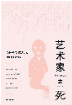
《艺术家之死：自媒体时代创意人士的生存处境与未来》