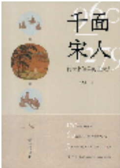
《千面宋人——传世书信里的士大夫》