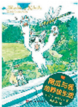
《南瓜与我的野放生活》