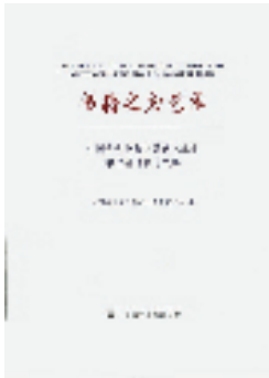
《书籍之为艺术——中国古代书籍中的艺术元素》

封宋代士大夫之间的往来私信，结合史料重新解读这些孤立的历史碎片，将书信中所涉的人、事、物及背后的故事巧妙地糅合成一个个完整的故事，从战场、为官、治学、人情、生死五大方面剖析宋代文人的社会关系、政治倾向、内心情感和才华品级，最后还原出一幅在宋代历史大背景下宋人普遍具有的性格共性拼图。同时，从范仲淹、欧阳修、司马光、苏轼等人情绪饱满的笔迹里，“破译”其波澜起伏的内心世界，以及蕴藏在每个文人身上独特的个性。