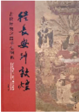
《从长安到敦煌——古代丝绸之路书法图典》