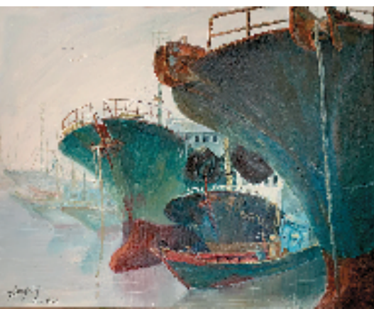
港湾 油画 海