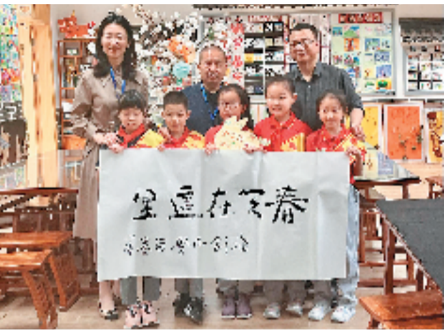
尹少淳教授题写的“春天在这里”

本报讯 通讯员 祝瑜芳 章薇薇 为更好地学习《义务教育阶段艺术课程标准(2022年版)》，促进新课标理念在中小学美术教学实践中的落地，4月17-19日，“浙江教研七十年”系列活动——浙江省中小学美术学科新课程关键问题解决研训活动在杭州市余杭区未来科技城海创小学举行。本次活动由浙江省教育厅教研室主办、杭州市基础教育教研室、杭州市余杭区教育发展研究院、杭州市余杭区未来科技城海创小学承办。