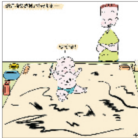
④最后,爸爸想到了一个好办法—— 哈哈