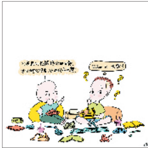
④小葵:凡高画的是鲜艳的向日葵,我的阿公很老,他画的是老葵! 同学:What is 老葵???