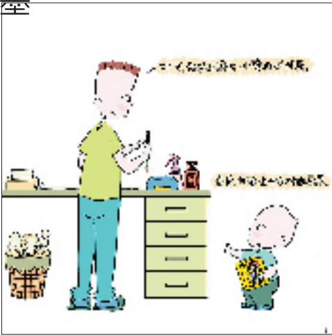
①小葵:爸爸,我想坐在你对面画画。 爸爸:好呀,爸爸画国画,小葵画蜡笔画。