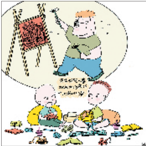
②因为我阿公喜欢画向日葵,所以我叫小葵!