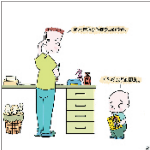
②小葵:可是我也想画国画。 爸爸:你画国画会弄得身上都是的。