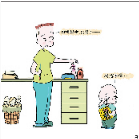
③小葵:我想要嘛…… 爸爸:好吧好吧,别哭了——