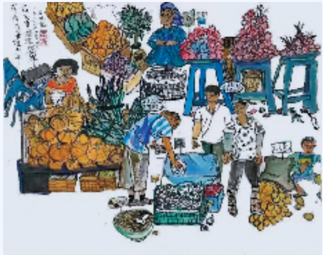
吕思懿(9岁 广西南宁市小阳聪美育少儿中心) 菜市场

正确认识美育,培育美好心灵。如今,不少家长将儿童绘画作为家庭美育的“入门课”,鼓励孩子从小拿起画笔尽情挥洒。但一些家长对绘画的认识产生误区,将画得“像”等同于画得“好”,使孩子与生俱来的创造力难以施展。应当注意,美术不只是一门造型艺术,更是一种精神活动。美育的目标并非只是让孩子们学会画画、唱歌、跳舞等技能,而是帮助孩子们感受世界,从而增强发现美、认识美、鉴赏美、表现美、创造美的综合能力。这样,孩子们才能逐渐树立正确的审美观念,激发想象力和创新意识,实现全面发展。