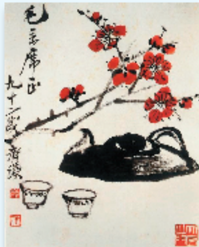
齐白石 茶具梅花图(中国画) 1952年