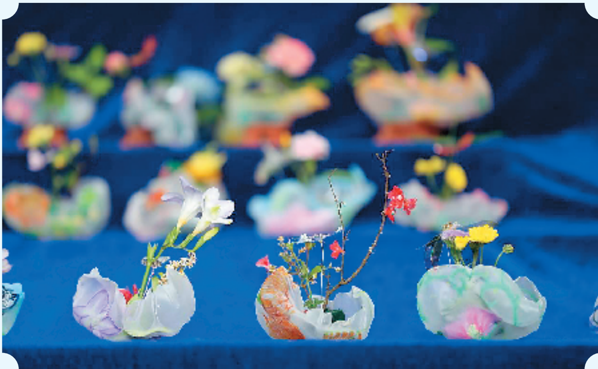
学生作品:拾光未来——热缩花器设计