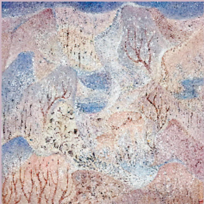
马楠 人间四月天 60×60cm 皮纸裱木板 矿物颜料 纯金箔 2023年

转眼间,我获得“妈妈”这个称号的第六个母亲节即将来临。陪伴女儿成长的时光如此美好,与她相处的过程让我变得放松、从容,改变了我生活工作的重心甚至创作的主题。《人间四月天》是林徽因写给儿子的诗句,满溢着爱与希望,借此题为母亲和孩子祝福。