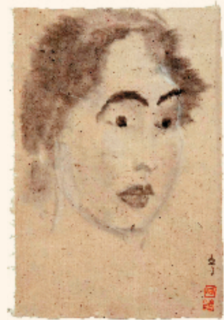
纪京宁 母亲之一 30×45cm 纸本水墨 2023年

转眼间,我获得“妈妈”这个称号的第六个母亲节即将来临。陪伴女儿成长的时光如此美好,与她相处的过程让我变得放松、从容,改变了我生活工作的重心甚至创作的主题。《人间四月天》是林徽因写给儿子的诗句,满溢着爱与希望,借此题为母亲和孩子祝福。