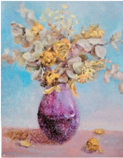
张浙鸳 紫色的花瓶 40x50cm

本报讯 蔡树农 日前,“西子有约·张浙鸳油画个展”在杭州吴山品悦艺术馆开幕,中国美院油画家秦大虎、常青等出席。 浙江当代油画院院长周瑞文作序:“这次展出的 30 余幅油画,是她近年来积累的作品。有风景,也有花卉静物,表现手法多样,有写实,也有写意,在用笔上有严谨表达,也有轻松挥写。”坚守真诚表达的艺术荣耀是毕业于中国美院壁画专业的张浙鸳身上的可贵品质,参加过浙江省一些重要油画展览,她的油画更多倾向于稳定的写实,相对灰调子的画面散发出一种“生”而不“庸”的淡淡幽丽。