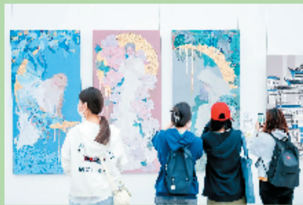
天津美术学院毕业展现场

本报讯 记者 俞越 见习记者 施涵予 夏日的蝉鸣如约而至，无声的离别即将来临，但一场场毕业大戏将离别的伤感冲散。在毕业展上的这一幅幅作品，不仅是学生个人成长轨迹的见证，也是当代中国青年艺术的缩影，激扬青春之志，彰显青春之为。