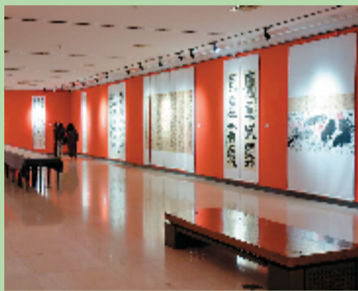
鲁迅美术学院毕业展现场