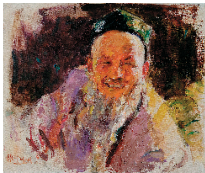
言师仲 瓜农之二 布面油画 2009年

本报讯 见习记者 施涵予 5月20日,旅美画家言师仲“阳光下的维吾尔人”油画作品展在全山石艺术中心开幕。展览于5月21日正式对外开放,展出画家60余幅描绘大美新疆的人物画作。