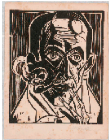
马克思·沛西斯坦因(德国) 自画像 木刻版画 28.3×34.2cm

相较京沪、广州、厦门、绍兴的鲁迅纪念馆陈列,这是一场小型而亲切的特展,亮点是在鲁迅收藏的画,因木心是位画家,而“五四”那代先驱,以鲁迅对美术的眷爱与博识,并世无第二人。鲁迅购藏的汉画像石拓本,计六千二百余枚,欧洲与中国的原拓版画,则逾四千多幅。其中,我们舍去通常备选的珂勒惠支与比亚兹莱,而聚焦尚未被重视的其它作品,藉以现代美术史范围,见证鲁迅异乎寻常的眼界。他不仅瞩目于当时苏联人绘制的文学插图,还搜罗刚在欧洲兴起的立体主义、表现主义等等,90年前的欧洲,现代版画尚属留待争议的新生事物,鲁迅已经热心购藏,并以之化育了第一代中国木刻家。与鲁迅无可争议的文学影响相比较,他生前何以格外看重视觉艺术,是有待进一步探知的命题——倡导美育的蔡元培,旅德期间曾买过十余枚立体派纸本作品,日后全数散失——而鲁迅之后,直到今天,再没有哪位中国文学家有过相似的艺术情结和美学教养。