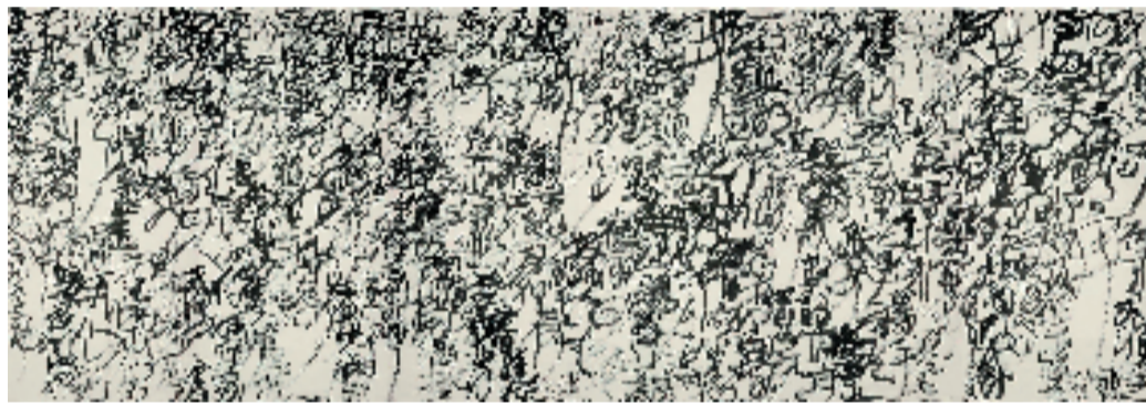
王冬龄 仰望星空—乱书霍金箴言 2023年