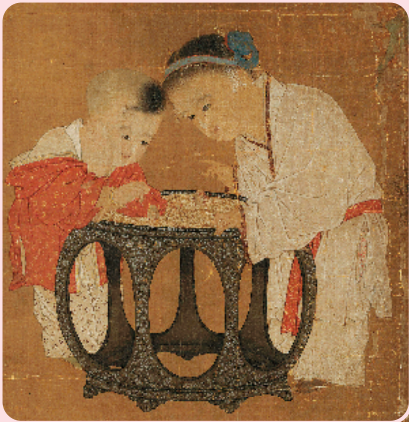
◀北宋 苏汉臣 秋庭戏婴图(局部) 台北故宫博物院藏

这幅画的作者是宋朝宫廷画家苏汉臣。画面中笋状的太湖石高高耸立,周围簇拥着盛开的芙蓉花与雏菊,两张崭新的凳子,两个小孩衣着光鲜亮丽,还有许多堆放在凳子上的玩具,足可以推断这是富贵人家的孩子。