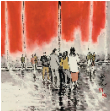
刘小明 现代印象:人物篇之六 50x50cm 纸本水墨 2022年

刘小明,北京人,师从李可染、高冠华先生。1990年代,他曾组织全国百名书画家共同绘制百米长卷《万里长城》《黄河之母》,策划、组织“中国书画绘画万里行”,骑单车到全国各地写生、创作并组织书画活动。1995年起深居简出,潜心研究绘画