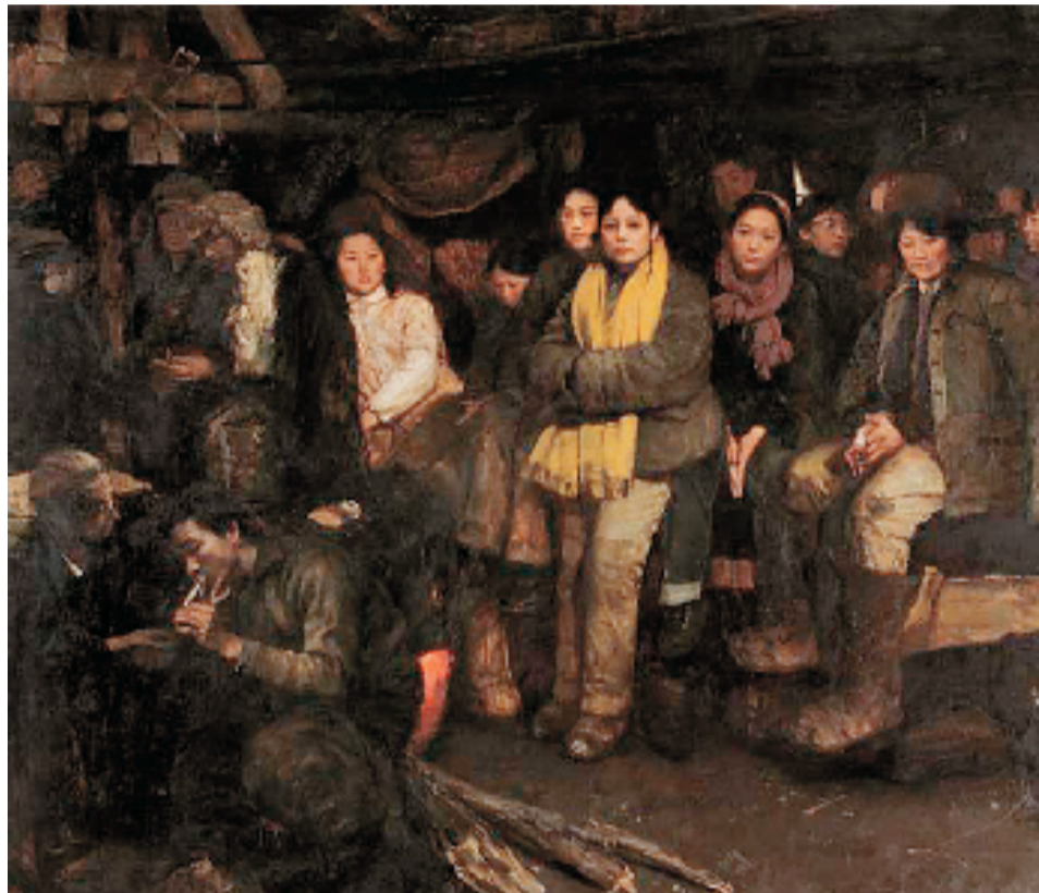
陈宜明 我们这代人 170x200cm 布面油画 1984年