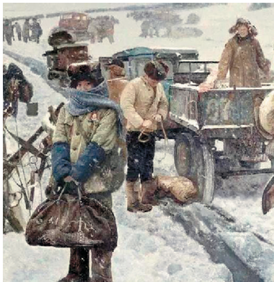
陈宜明 青春记忆——知识青年上山下乡(局部) 300x500cm 布面油画 2009年